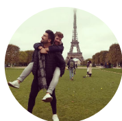
ANDER - ESPAGNE