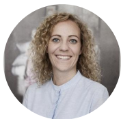
ELLEN - DANEMARK

FORMATION ÉLIGIBLE VISA ÉTUDIANT À PARTIR DE 225 €/SEMAINE