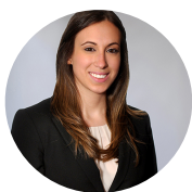
MARTA - ITALIE